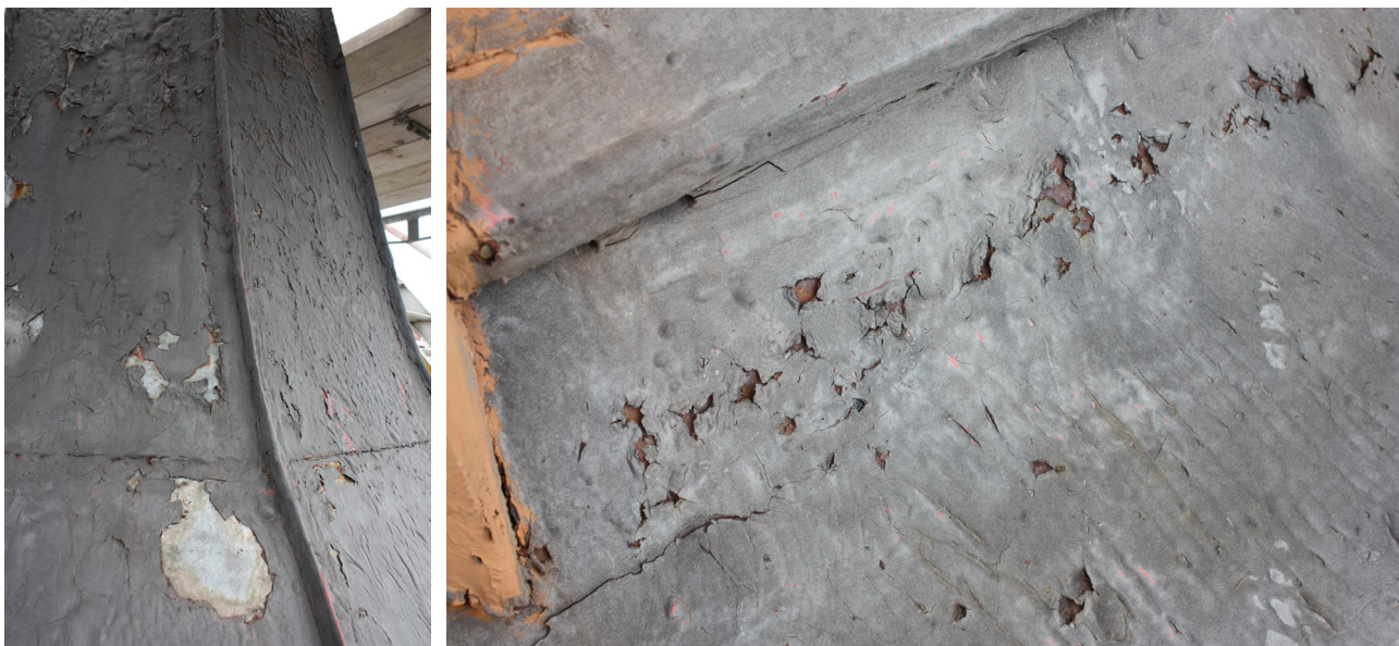
Fig. 12-13. Korrosionsskador föranleder takbyte. Orsakad av s k Hagmannitmassa.

få återbehandlingsbara rostskyddsbehandlingar för rostiga järn- och stålytor på plats. Den är ”robust” och fungerar för grundmålning av såväl svartplåt som åldrad förzinkad plåt. Två lager blymönja under täckmålning med linoljefärg ger lång livslängd. Alkydoljeinnehållande blymönja har med fördel låg halt av lösningsmedel, eftersom det annars medför ökad risk för resning av underliggande färg. Har man börjat använda blymönjegrund är det viktigt att underhåll och bättring sker lokalt då mönjan börjar bli synlig p.g.a. erosion. Falsar är känsligt område för skador. Underhållsmålning av svartplåt utan blymönja som rostskydd ger snabbt rostgenomslag. Då krävs underhållsmålning cirka vart tredje år, av både korrosionshänsyn och estetiska skäl. Blymönjegrund är inte motiverad på ny förzinkad plåt. Blymönja är godkänd för professionellt bruk och användning bör utföras med tanke på att det