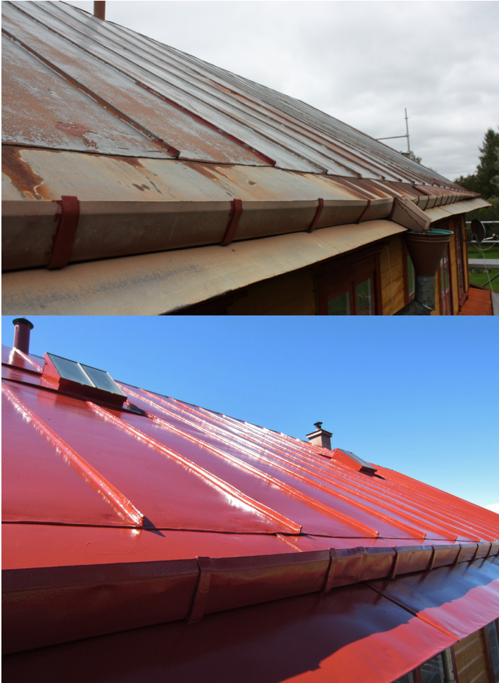
Fig. 8-9. Bandtäckt, fabriksmålat (flagande Plastisol) plåttak från 1990-talet. Det sandblästras och slipas manuellt, tvättas, innan det målas med fosfatrisk alkydolja grundfärg och sedan modifierad linolja färg. Idelunds Möbelfabrik.

Plastisol finns bl.a. i handboken Byggnadsplåt 13 från Plåtslagarnas Riksförbund. PVF2, polyester och akrylat innehåller inte mjukgörare. Styrenakrylat (akrylatharts) förspredas av UV-ljus.