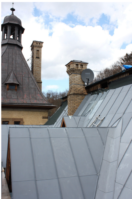
Fig. 10. Delvis ny, förprimad plåt (polyester) som sedan målas med linoljafärg. Slottsvillan i Huskvarna, byggnadsminne.